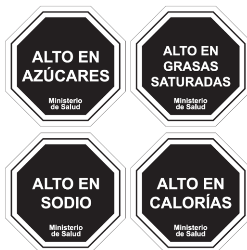
Diagrama N° 1

Cuando la información especificada en este artículo no haya sido considerada en el diseño de la gráfica original de la rotulación, se permitirá adherirla en la etiqueta o envase, de modo indeleble, y de acuerdo al tamaño, ubicación y demás características establecidas en este reglamento.